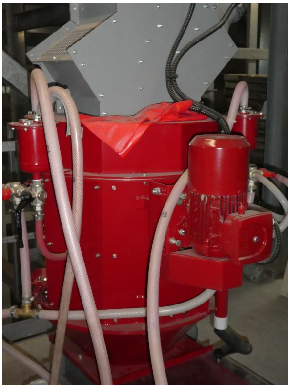
Bild 3: Professionelle Beizung, ab 2021 müssen alle Beizgeräte die TÜV-Anforderungen nachweislich erfüllen