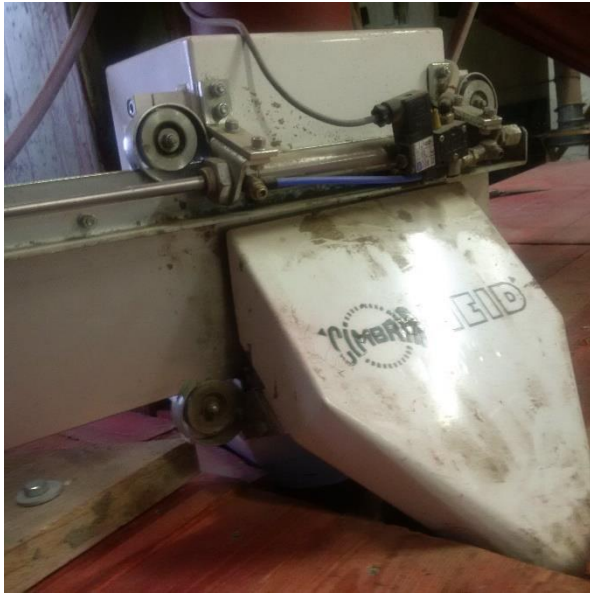
Bild 1: Repräsentative Beprobung von Saatgut durch in den Saatgutstrom eingebautes automatisches Probenahmegerät